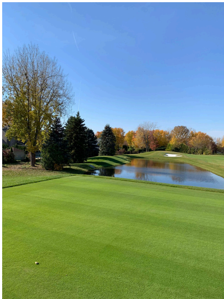
Nouveau lac Parcours Rouge Trou #3