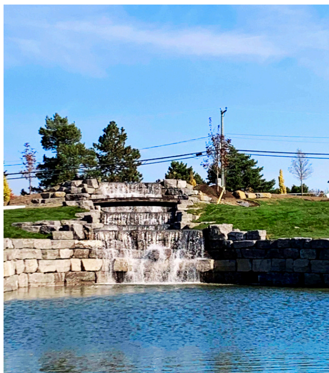
Nouveau lac et chute d'eau Parcours Rouge Trou #8