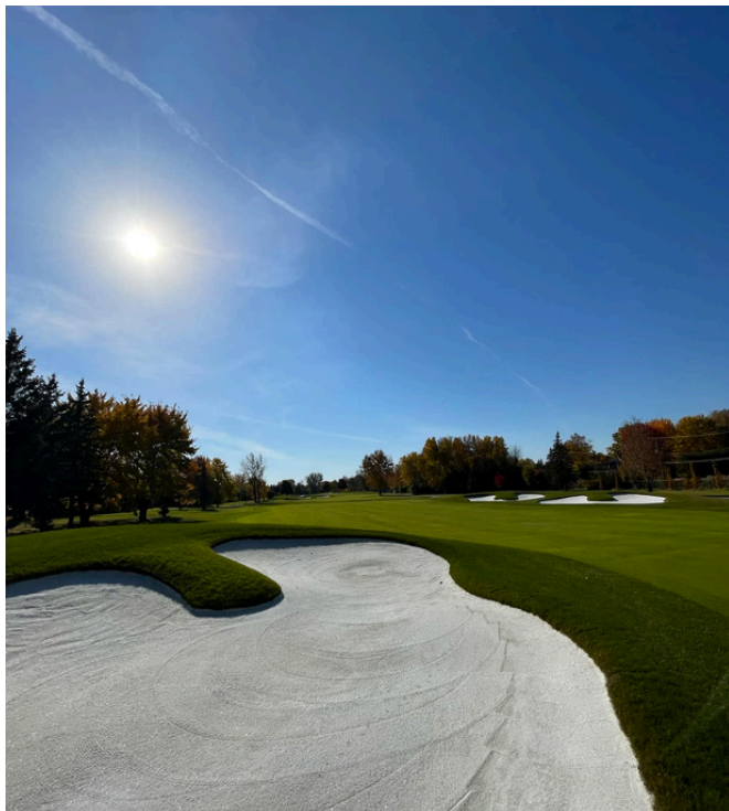
Nouvelles trappes de sable blanc Parcours Rouge Trou #4